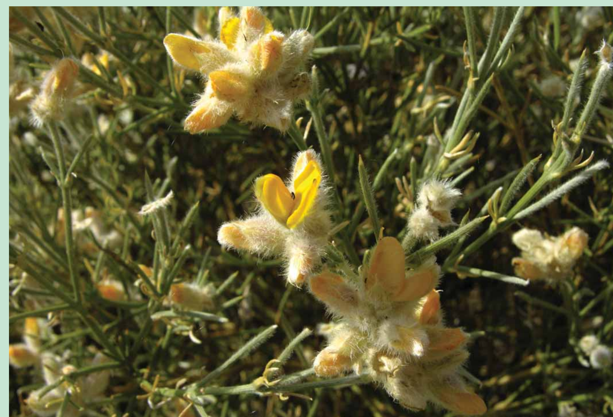
CALDONEIRA Echinopartum ibericum