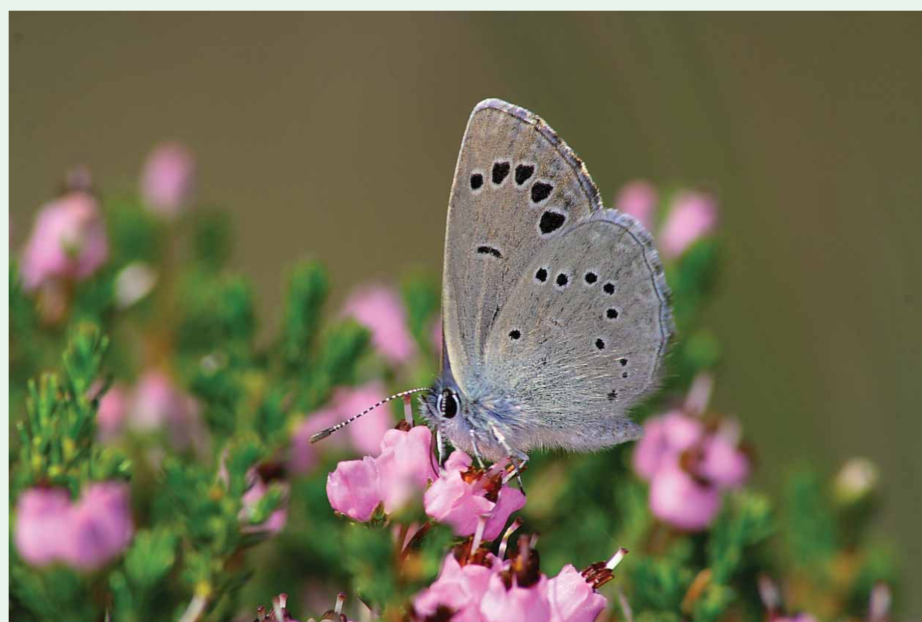
Época de voo: Março a Julho