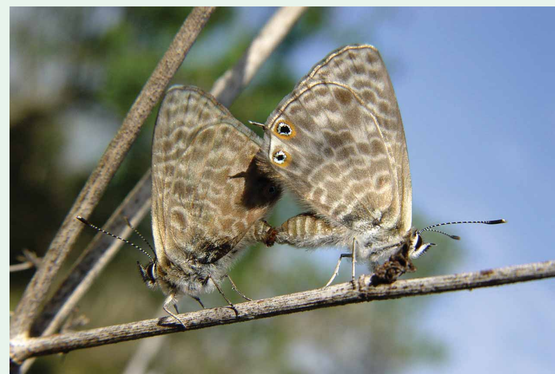
Época de voo: Fevereiro a Dezembro