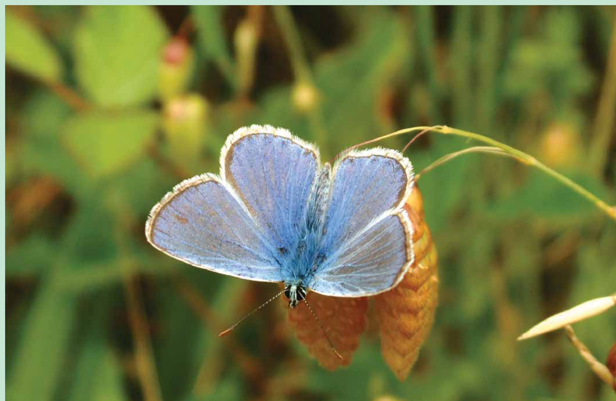
Macho Época de voo: Março a Outubro