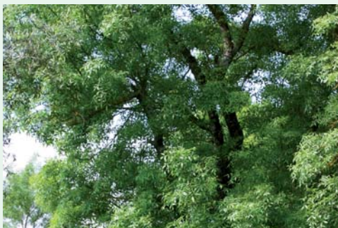
FREIXO-COMUM | Narrow-leafed ash Fraxinus angustifolia Eudicotiledones / Oleaceae

O FREIXO É UMA DAS ÁRVORES TÍPICAS DAS MARGENS DOS RIOS E RIBEIRAS | The Narrow-leafed ash is a common tree found near rivers and water streams