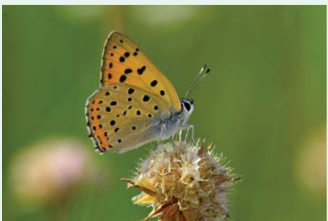
ACOBREADA-DA-ÁGUA | Sooty Copper Lycena lityrus Insecta / Lepidoptera / Lycaenidae