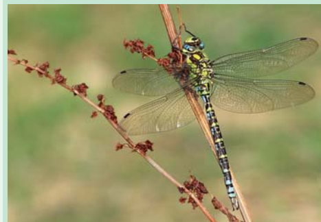
LIBÉLULA | Blued Hawker Aeshna cyanaea Insecta / Odonata / Aeshnidae

COMO AS LIBÉLULAS, QUE SÃO INSECTOS COM LARVAS AQUÁTICAS Dragonflies are insects with aquatic larvae