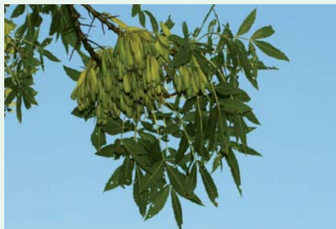
Folhas e frutos. Leaves and fruits