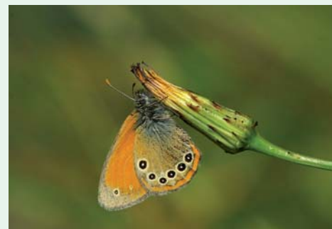
NÉSPERA-DOS-OCELOS-NEGROS | Spanish Heath Coenonympha glycerion Insecta / Lepidoptera / Nymphalidae

Na Península Ibérica voa esta subespécie designada por iphioides , que tem grandes ocelos negros nas asas posteriores. Época de voo: Junho a Agosto