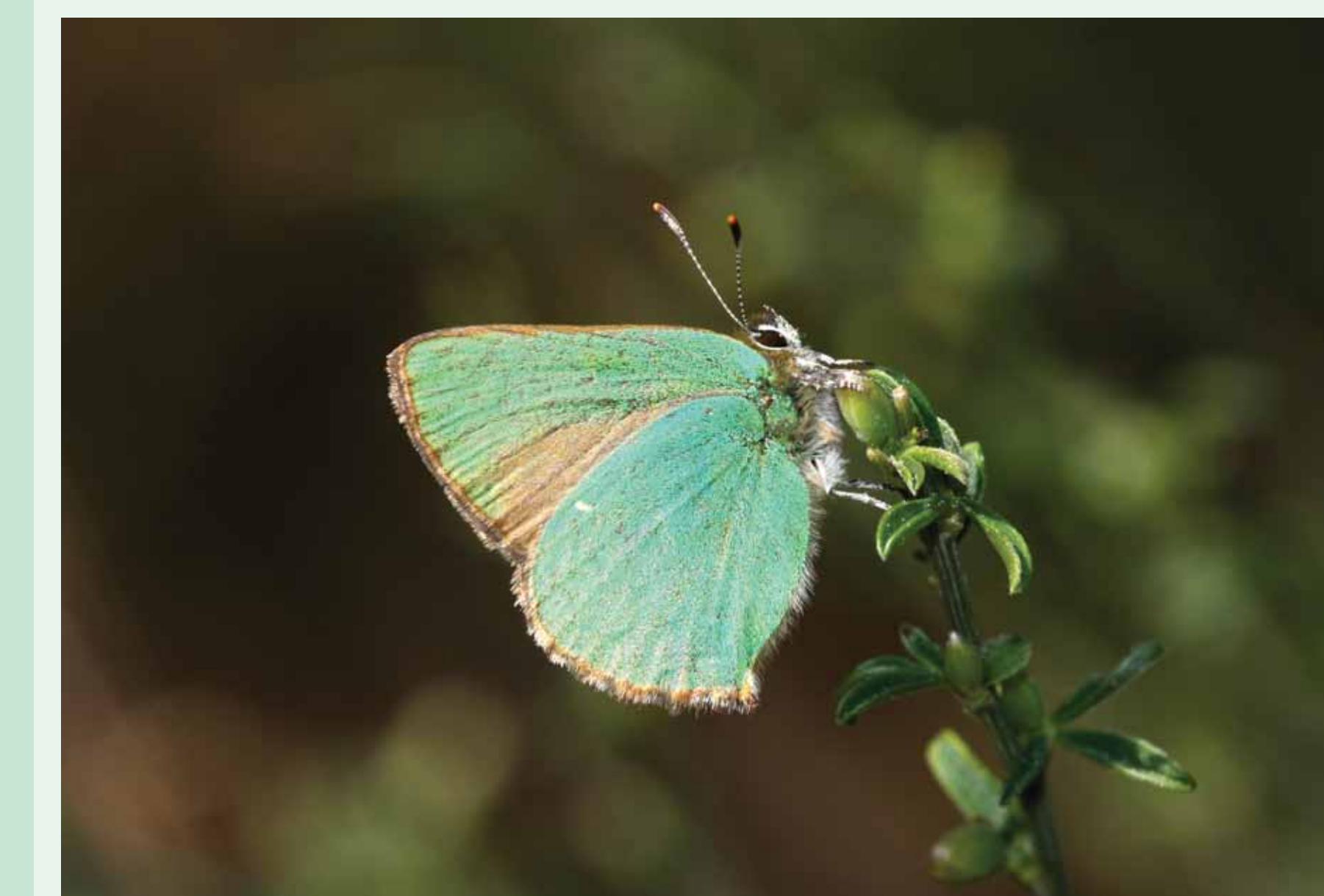
RUBI | Green Hairstreak - Callophrys rubi Insecta/ Lepidoptera/ Lycaenidae