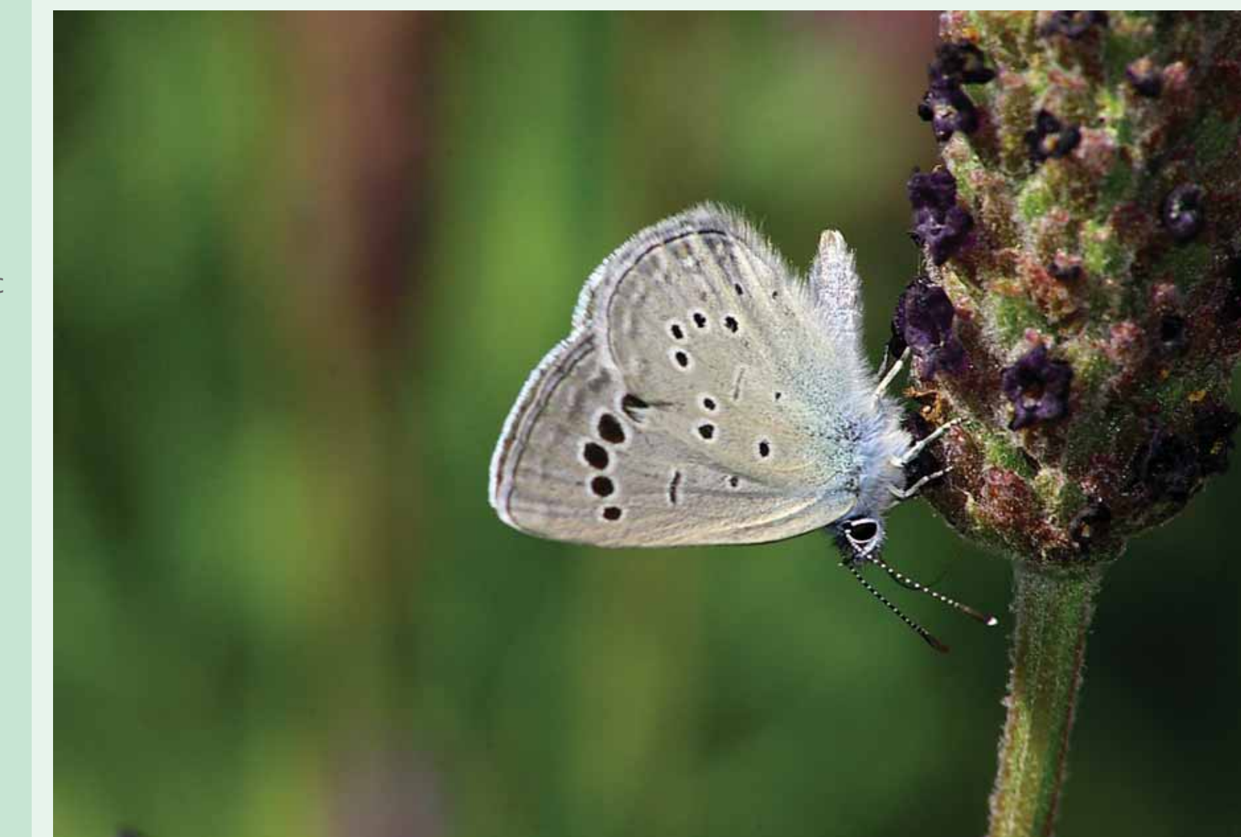
AZUL-DOS-OCELOS-NEGROS | Black-eyed Blue - Glaucopsyche melanops Insecta/ Lepidoptera/ Lycaenidae