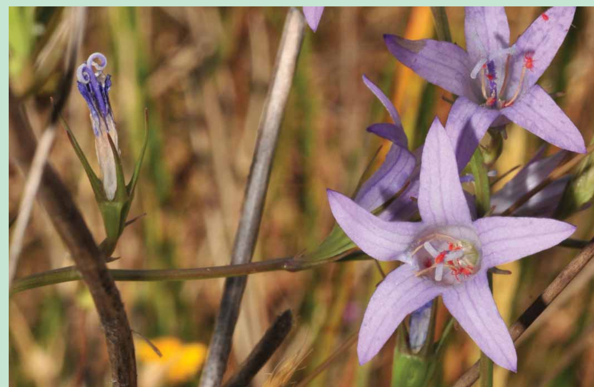
CAMPAINHAS | Bellflower - Campanula lusitanica Eudicotiledonea / Campanulaceae

Época de floração: Março a Agosto Blooming flower: March to August