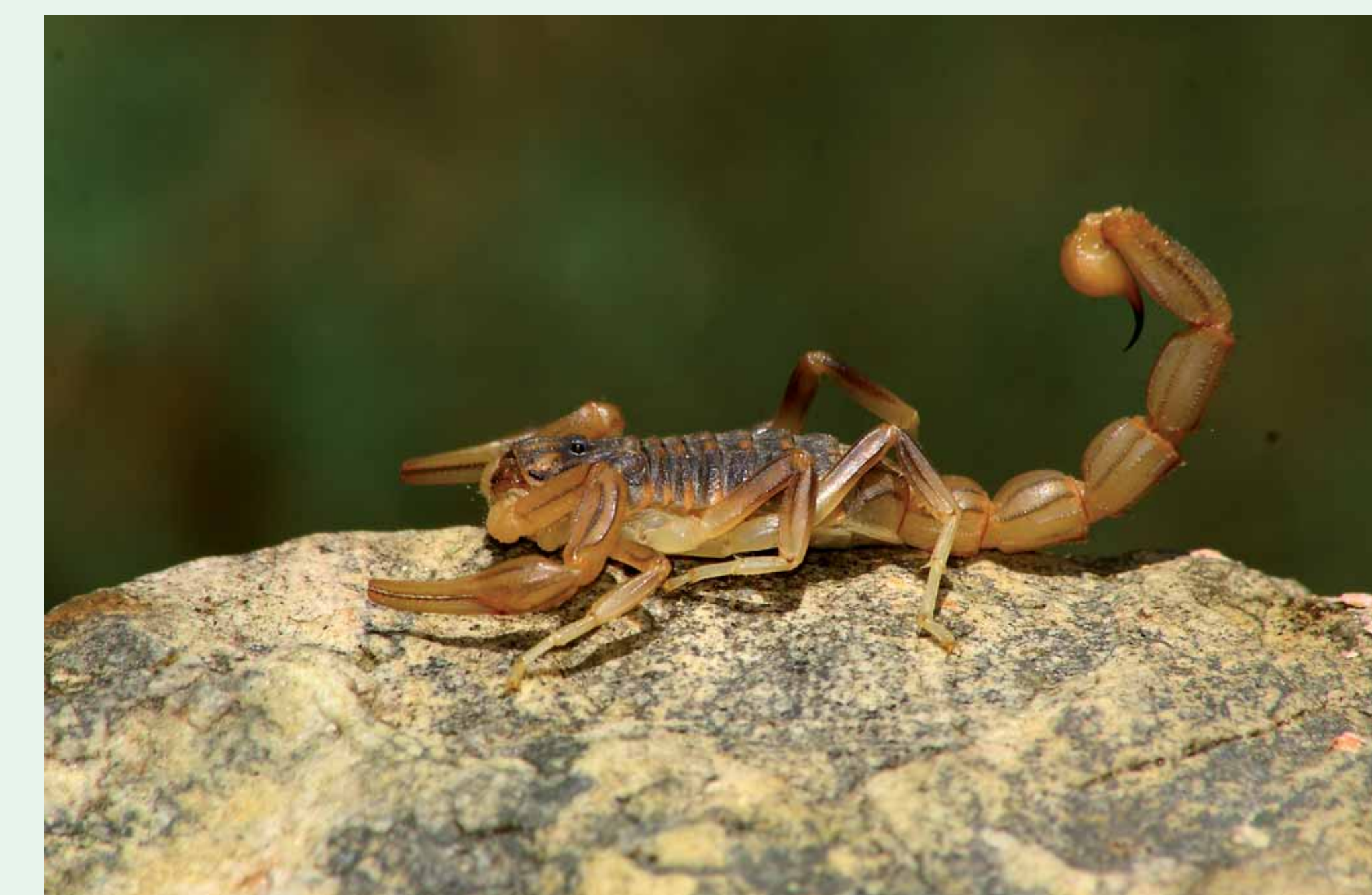
LACRAU | Common Yellow Scorpion - Buthus occitanus Arachnida / Scorpiones / Buthidae