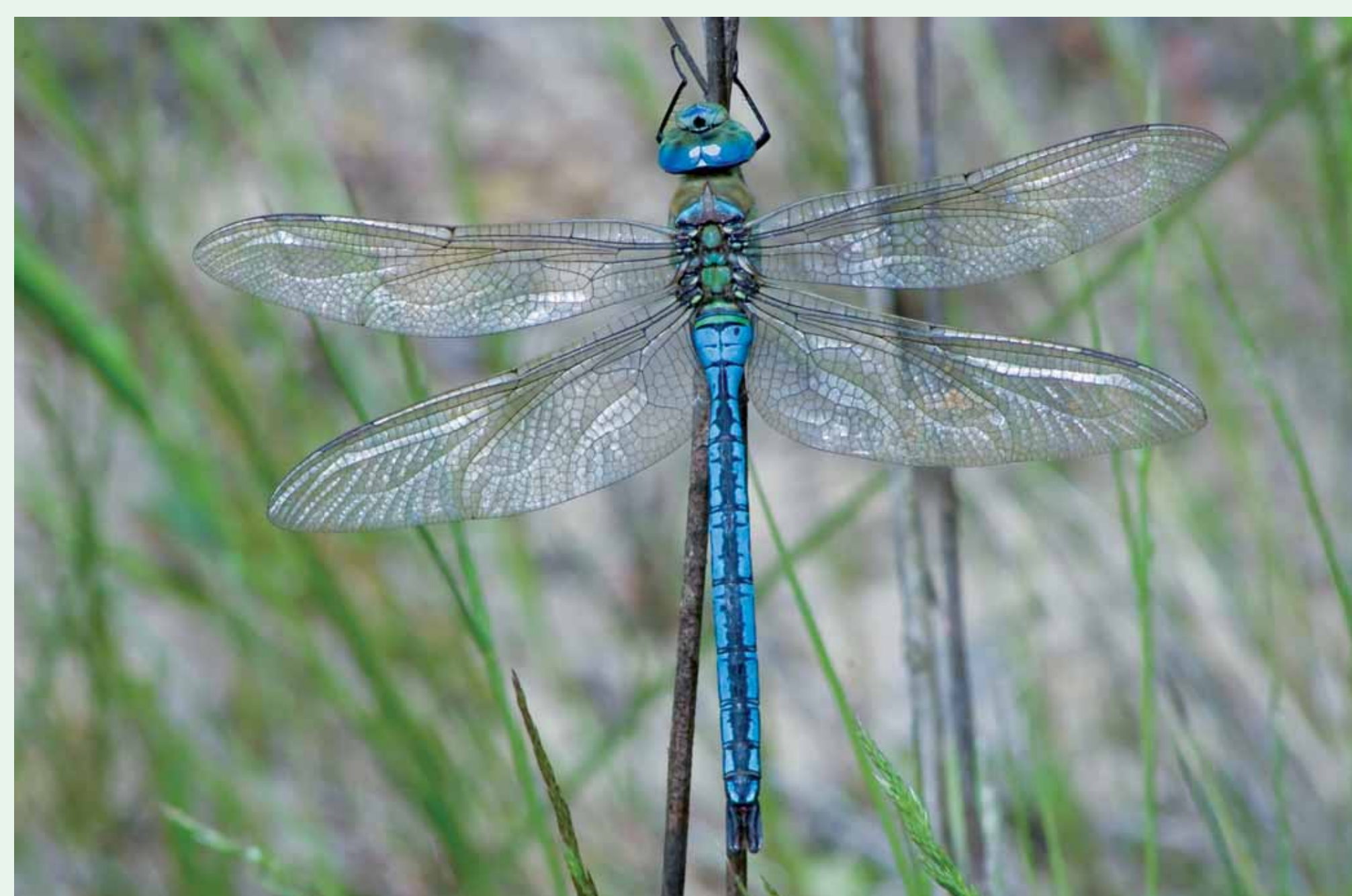
IMPERADOR-AZUL | Blue Emperor - Anax imperator Insecta / Odonata / Aeshnidae