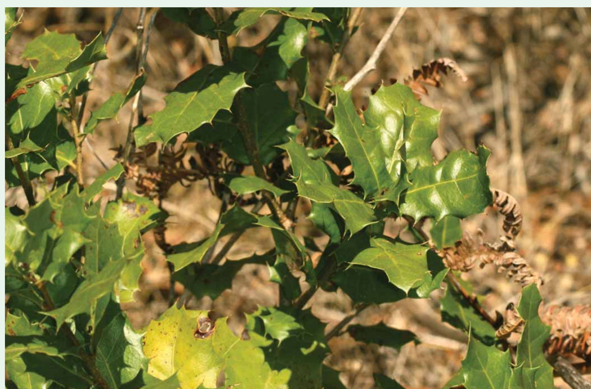
AZEVINHO | European holly - Ilex aquifolium Eudicotiledonea / Aquifoliaceae