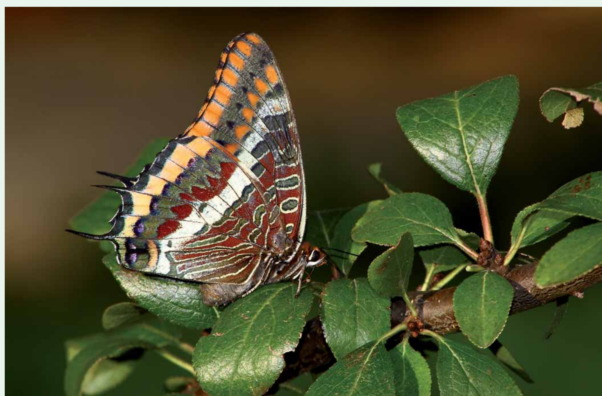
BORBOLETA-DO-MEDRONHEIRO | Two-tailed Pasha - Charaxes jasius Insecta / Lepidoptera / Nymphalidae