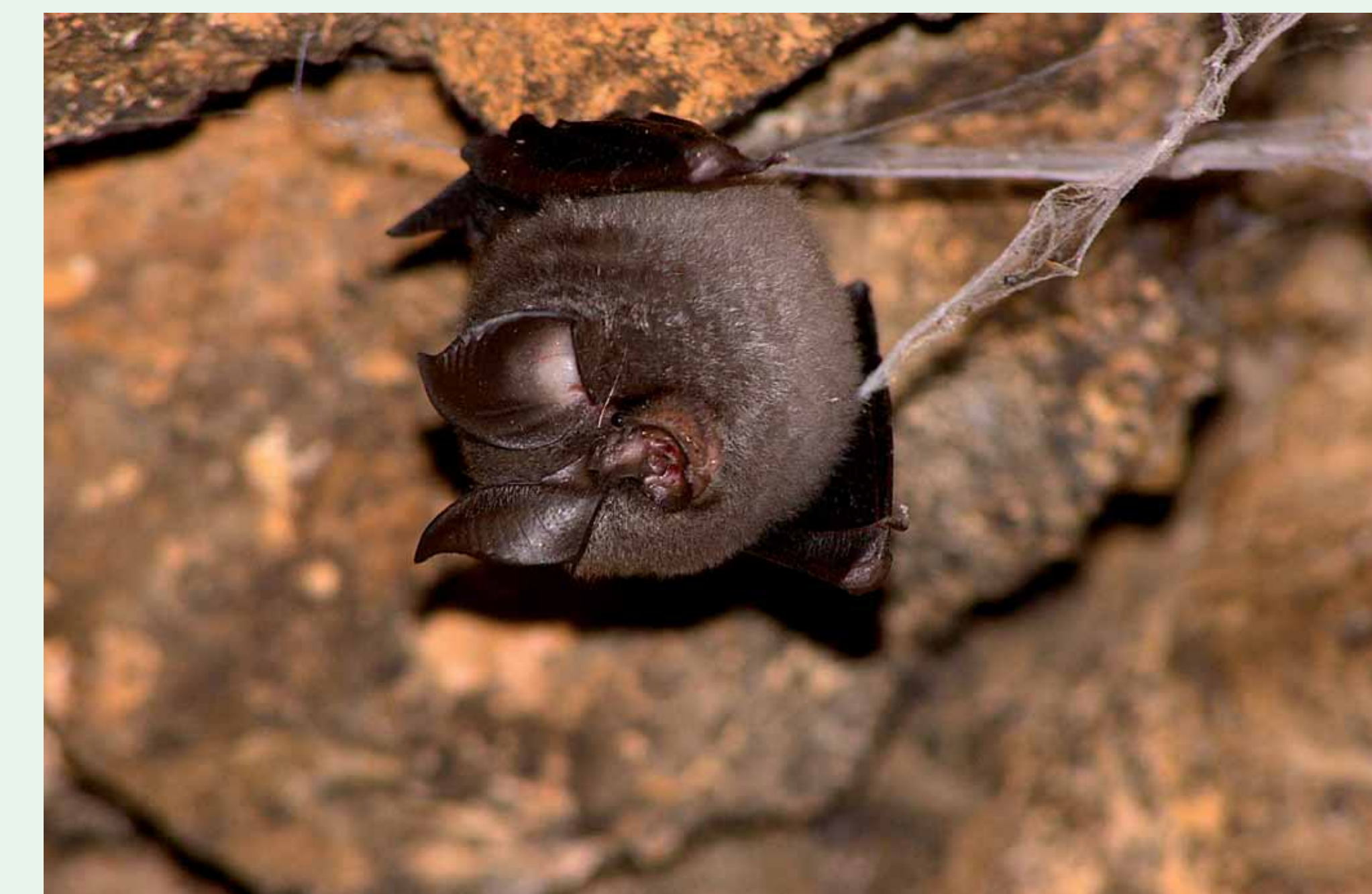
MORCEGO-FERRADURA | Horseshoe bat - Rhinolophus sp. Mamalia / Chiroptera / Rhinolophidae

mais informação em / more information in: www.biodiversity4all.org