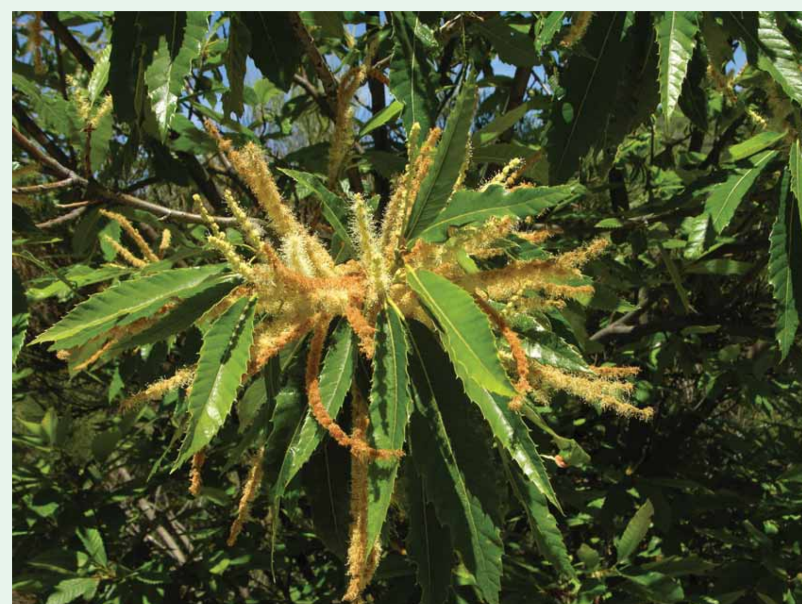
CASTANHEIRO | Chestnut tree – Castanea sativa – P2