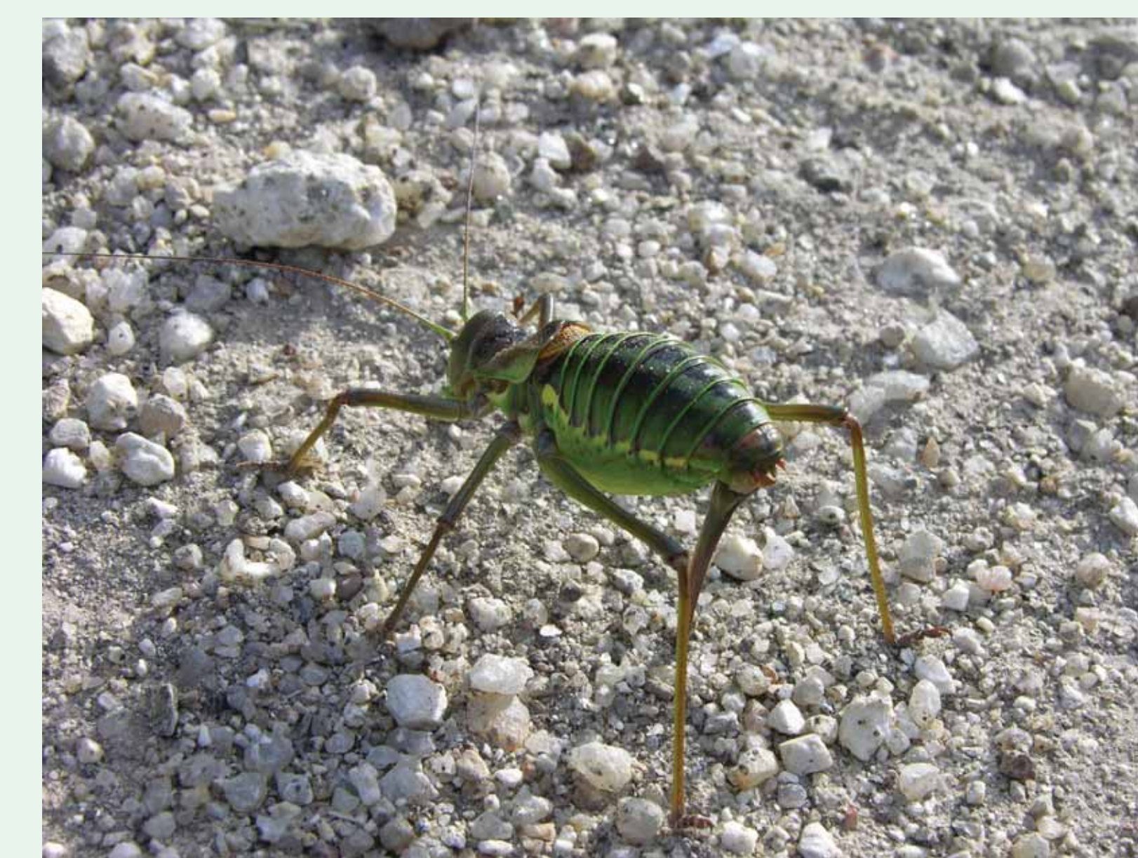
GRILLO-DE-SELA | Saddle-backed Bush-cricket – Neocallicrania miegii – P3

BOM PASSEIO E ATÉ BREVE! Have a nice journey and see you soon!